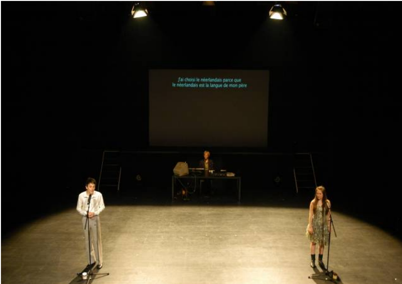
« Pouillot » - Théâtre Marni 2005